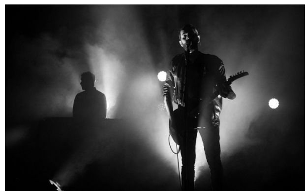
1. Cigarettes After Sex, by Jamie MacMillan, 2018

P.S.: Ein etwas anderer Lichtblick für die dunkleren Monate des Jahres: Ihr zweites Album erscheint Ende Oktober dieses Jahres!